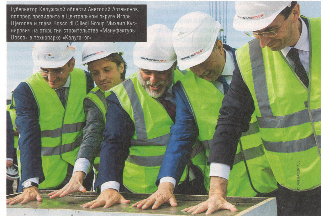
Губернатор Калужской области Анатолий Артамонов, полпред президента в Центральном округе Игорь Щеголев и глава Bosco di Ciliegi Group Михаил Куснирович на открытии строительства «Мануфактуры Bosco» в технопарке «Калуга-Юг»

Именно личность мы должны сделать центром инвестиций, а показатель умножения человеческого капитала должен стать более значимым, чем показатель прироста ВВП.